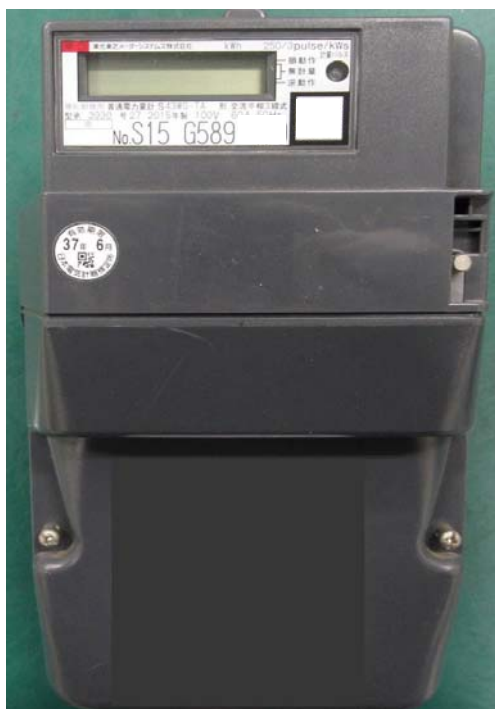
故障が発生したスマートメーターの外観 (外観上の異常は見られない)