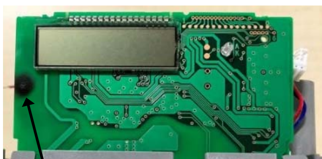
直径:約 7mm 正面側